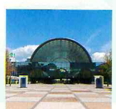
インテックス大阪