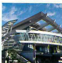
さいたまスーパーアリーナ